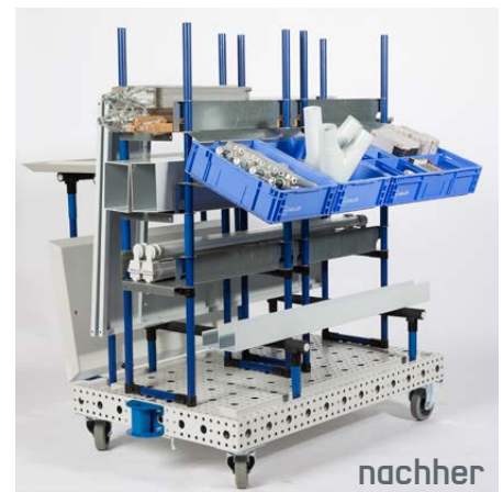
Vorher: starre Materialbereitstellung am Boden · Nachher: 4Dflexiplat als Set-Wagen (Kitting)