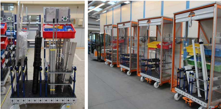
Ergonomische und übersichtliche Material-Bereitstellung auf 4Dflexiplat mit 3D Aufbau. Transport im Routenzug zwischen Montage- und Lagerhalle.

Durchlaufzeitverkürzung durch Einrichtung einer Taktfertigung (Montage) und Umstellung auf PULL-System sind 2015 Themen bei Hauni. Die Materialbereitstellung erfolgte im Ursprung in Gitterboxen. Mit dem modularen Transportgestell 4Dflexiplat konnten die Projektziele erfolgreich erreicht werden.